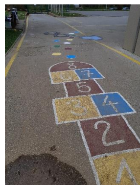
Slika 5: Ristanc in krogci

Razmišljali smo o različnih možnostih izvedbe festivala (čas, kraj, komu bi bil festival namenjen, o izvedbi, organizaciji ...).