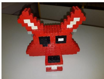
Slika 8: Sestavljanje različnih oblik iz lego kock

Festival bo potekal tako, da se bo na glavnem prizorišču – športnem igrišču odvijal povezovalni program, na šestih mestih v okolici igrišča pa bodo potekale različne aktivnosti (delavnice, degustacije, bazar ...). Vse aktivnosti bodo tematsko povezane s kocko.