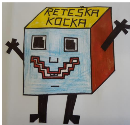
Slika 10: Logotip festivala Reteška kocka