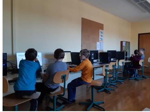
Slika 7: Delo v računalniški učilnici - dečki