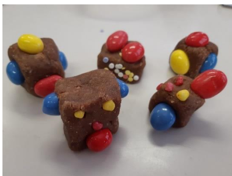
Slika 9: Sladica reteška kocka