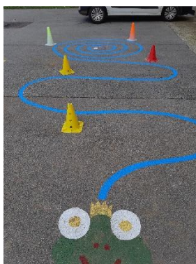
Slika 4: Žabec in kača