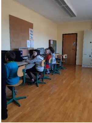
Slika 6: Delo v računalniški učilnici - dekleta