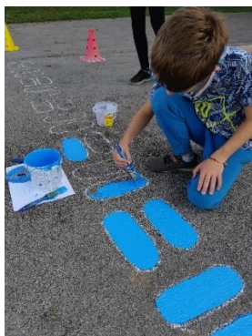
Slika 3: Risanje poligona